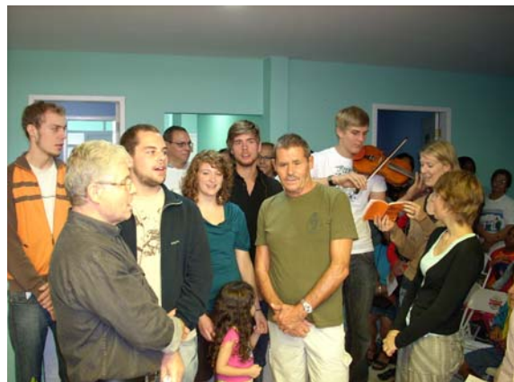
Eine Gruppe aus Deutschland, zu Besuch in den Einrichtungen der AVICRES, gratuliert zur Wiedereröffnung der erweiterten Gesundheitsstation.